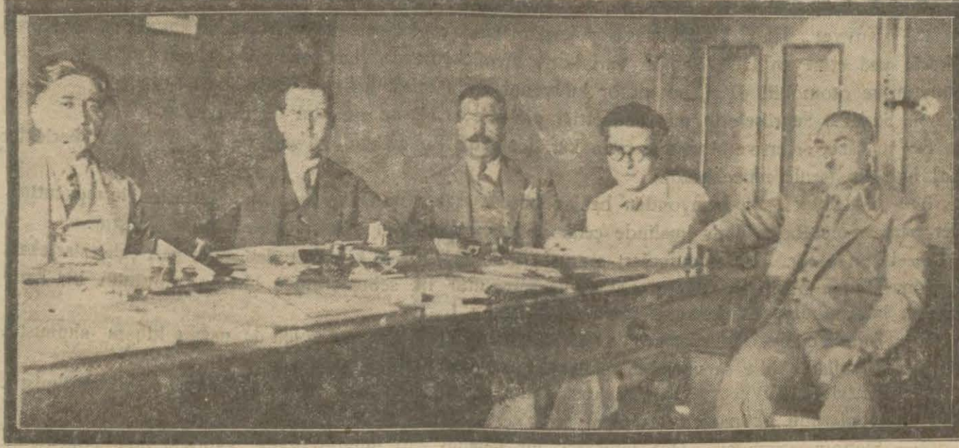
Peynir tacirleri dün ticaret odasında bir içtima akdetmişler ve peynirciliğin tekâmülü için müzakeratta bulunmuşlardır