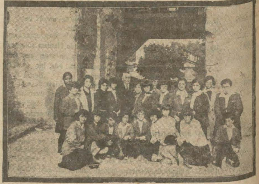
Kadıköy kız orta mektebi talebesi dün gülhane parkında bir gezinti yapmışlardır