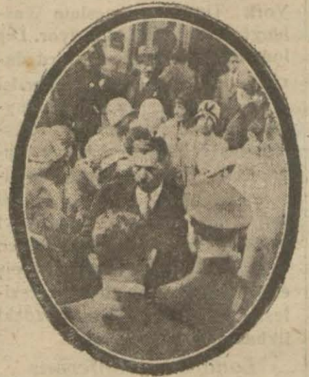
Kâzım Paşa ve refikaları İstasyonda teşeyicileri arasında

Kâzım paşa hazretleriyle bazı mebuslar ve alle dostlarından müteşekkil kesif bir zümre teşey için garda toplanmışlar ve hayırlı seyahatlar temenni etmişlerdir. Teşeyde bulunan Şe-