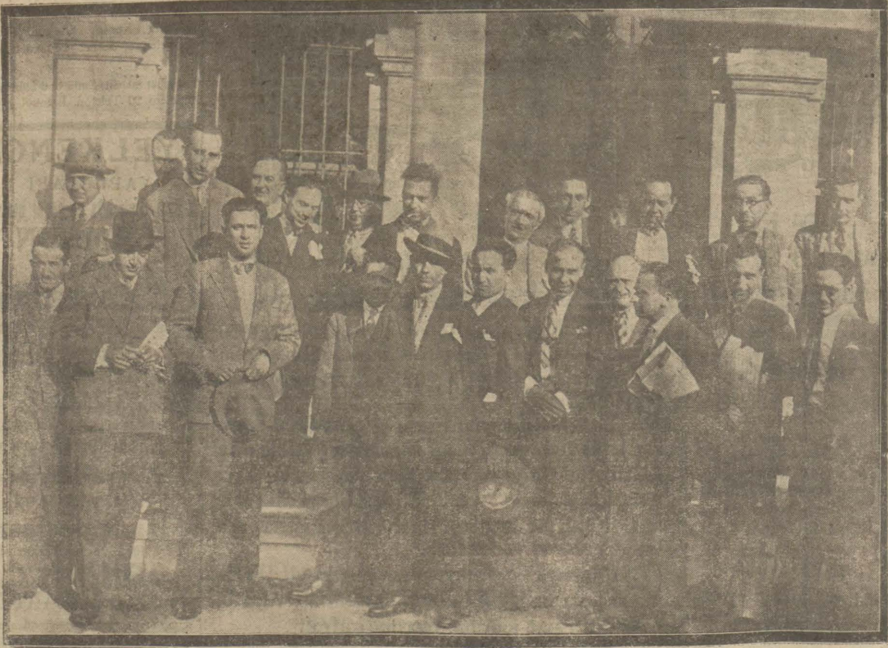
Türk Matbuat cemiyeti kongresi dün Türlü ocağında toplanmıştır. Kongrede muhtelif meseleler hararetle görüşülmüştür. Resmîliiz konreye iştirak eden azadan bir kısmını göstermektedir.