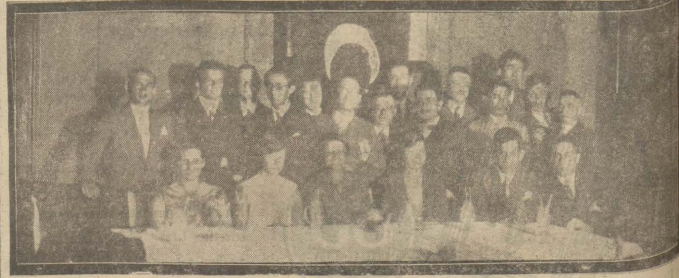
Laypzik Türk talebe cemiyetinin yedinci devri senevî tesit eden Laypzikteki Türk talebe