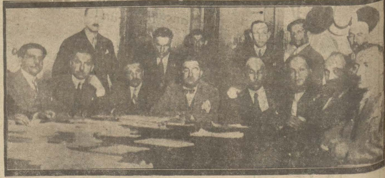
Sanayi birliği kongresi dün toplanmış, yerli malları sergisi hakkında müzakere yapmıştır.