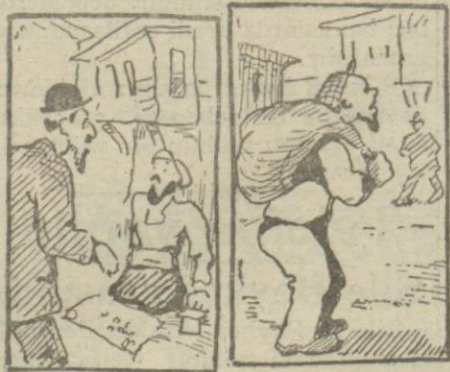
1 — Balatın yegâne dilencisi

rırlar. Öteki beriki duyar, derhal mahalleye oradan da bütün İstanbulu yayılır."