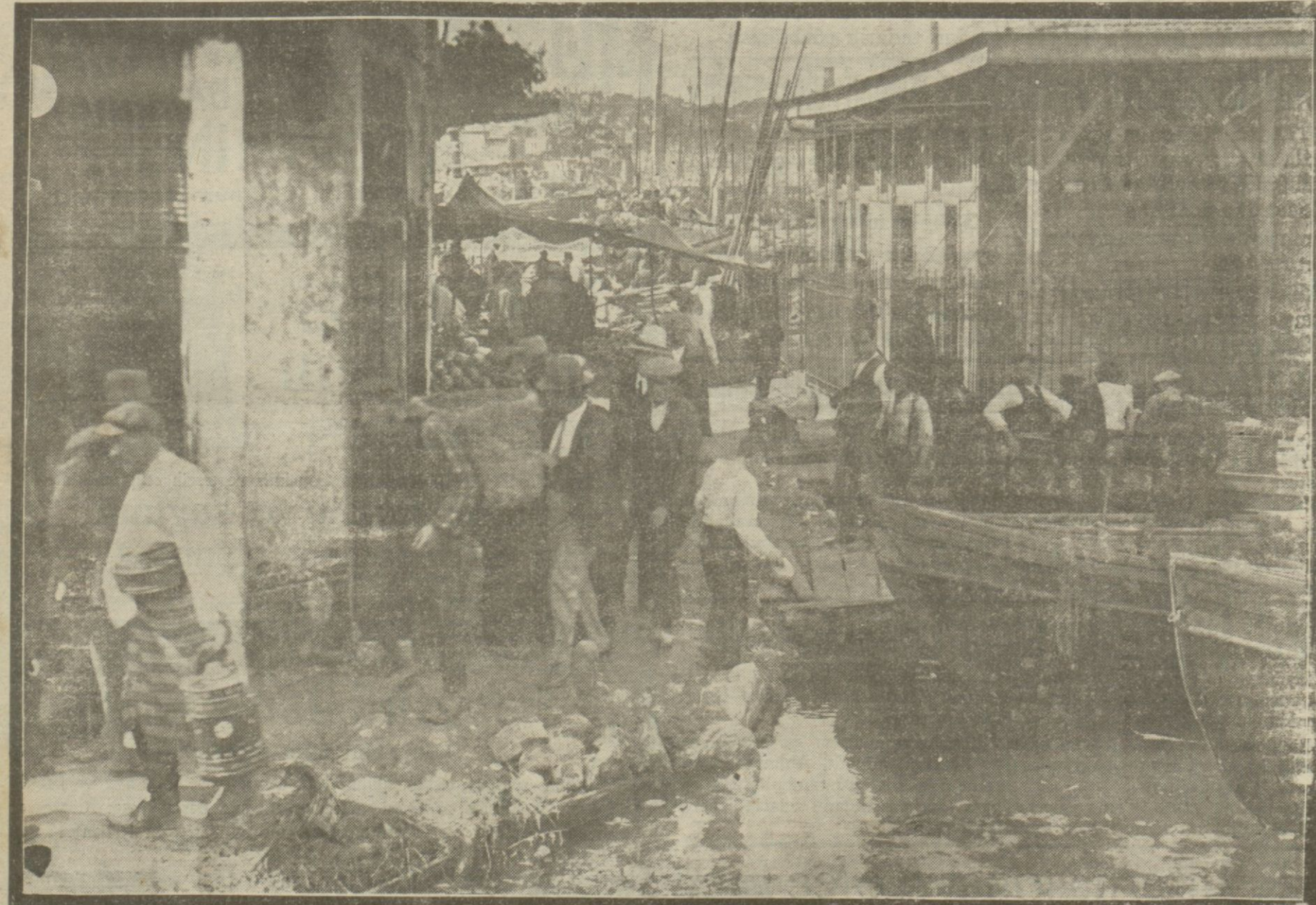
Yemiş sokakları İstanbulun hiç şüphesiz en pis ve en ılgıncı yeridir. Bu pislik bilhassa Yemiş vapur iskelesi civarında gözle çarpıcıdır. Buraları gayet ufak bir masrafla düzelebileceği halde bugün geçilemeyecek bir haldedir.

OKSİMENTOL (PERODEN) Üsürük-Bogaz hastalıklarında. VELUTA SABUNU en sihi dir. KEFALJİN baş, diş ve her türlü ağrıları karşılar.