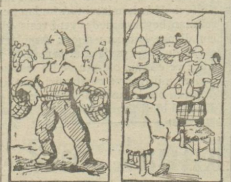
2 — Paçavra toplar.

rılır. Öteki beriki duyar, derhal mahalleye oradan da bütün İstanbulu yayılır."