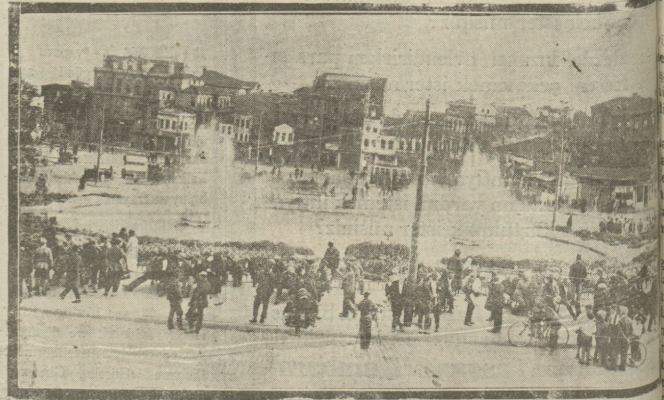
Bayazıttaki büyük havuzun etrafı Cuma günü halkın en çok eğlendiği bir yer olmaktadır.