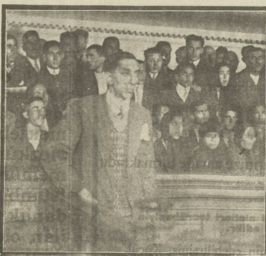
11000 lira ibtilâs eden Muhtarın muhakemesi dün yapıldı. Ve muhtelis beş sene ağır hapis mahkûm oldu.