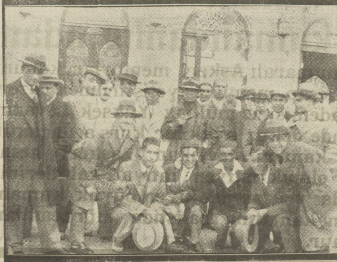
Fenerbahçe takımı Bursa maçından döndü. Avdelerine ait bir fotoğraf.