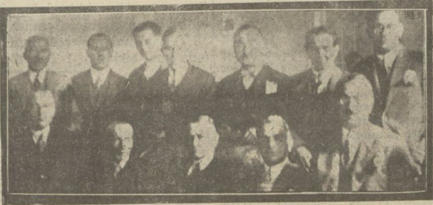
Muhtelit mübadele komisyonu azası dünkü içtimada