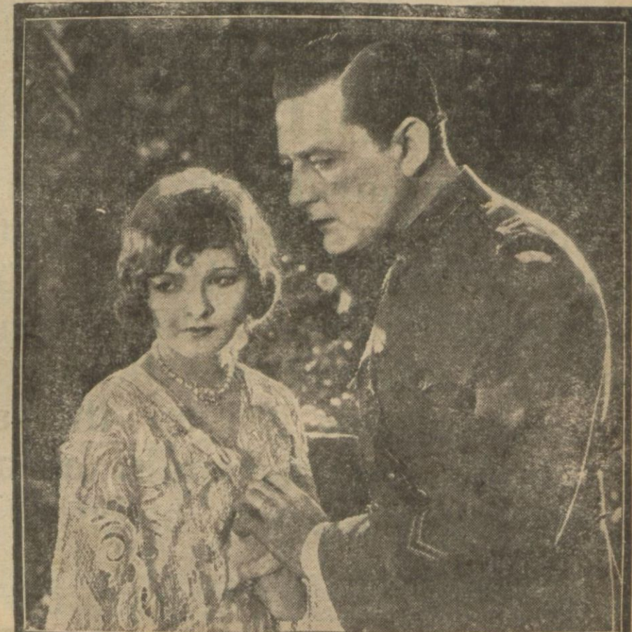
Kırık kalpler filminden

Esasen büyük şehirlerde halk sessiz filmlerden bıktıkları için sesliye büyük rağbet vardır. Bu rağbet ve bu tediyi kolaylığı karşısında sinema müdürleri sesli teçhizat almakta ve rakabet yüzünden bu hareket her tarafa sırayet etmektedir. Avrupada ise sesli film makinaları imalâtı henüz seri halinde değil tecrübe devresindedir. Elde de sessiz film malzelesi çoktur, o sebeple bu işde Avrupa panu davayı kaybettini kabul etmek zaruretindeyiz.