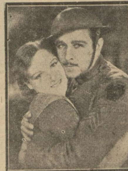
Kadının harbe gidişi filminden

Film Amerikanın Universal mamulâtındandır. Çok elim ve heyecanlıdır.