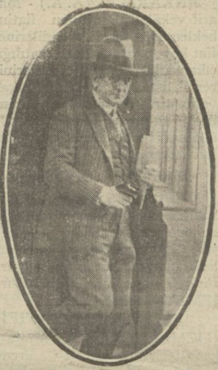
M. Holştad içtimadan çıkarken

Muahedenin tamamen tatbikini istiyoruz; Yunan murahhaslarile hayli mücadele edildi