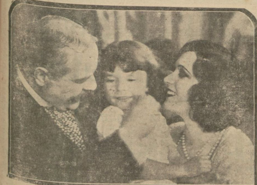
Yaşayan ölü filminden

Eğer sesli sözlü film yapmak imkânını bulamazlarsa konuşanların adedi az olan diller şimdilik ancak çok görüşülen başka lisanslarda yapılmış filmleri dinleyebileceklerdir.