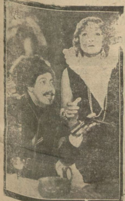
Kızıl kadın filminden

Bundan üç ay evvel tekrar bağlamak üzere tatil ettiğimiz sinema neşriyatımıza bugün vadedimiz mucibince başlıyoruz. Geçen üç ay yaz tatilinde şehir hayatına aleminde sayıyı dikkat tahavvülât vukua geldi.