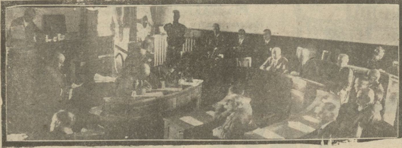
Dün Cezaletti umumiyele belediye içtima ederek muhtelif meseleler konuşulmuş ve bilhassa Cerrah Paşa hastanesine getirilecek radyotrapı mütehasşısı hakkında münakaşa olmuştur.