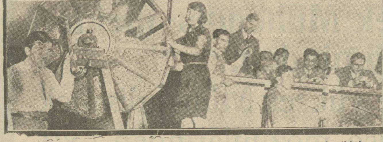
Dün Darülfünun konferans salonunda Tayyare piyankosu çekilmiş ve bu iki hanım kız piyanko dolabını çeviren talihillere şans dağıtmışlardır.