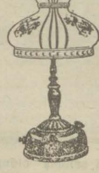
Güzel biçimli bir (Kolman) lambası