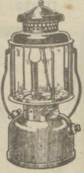
Kolman feneri en şiddetli havalarda metanetini muha- faza eder

Benzin ile yanan, ve bir çocuk tarafın- dan istimal edilebi- lecek kadar basit o- lan bu fenerler ve lambalar emsalline kat kat falktırılar.