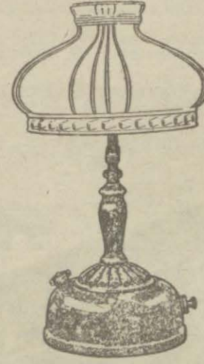
Kolman lamba- sının zarafeti derhal göze car- par