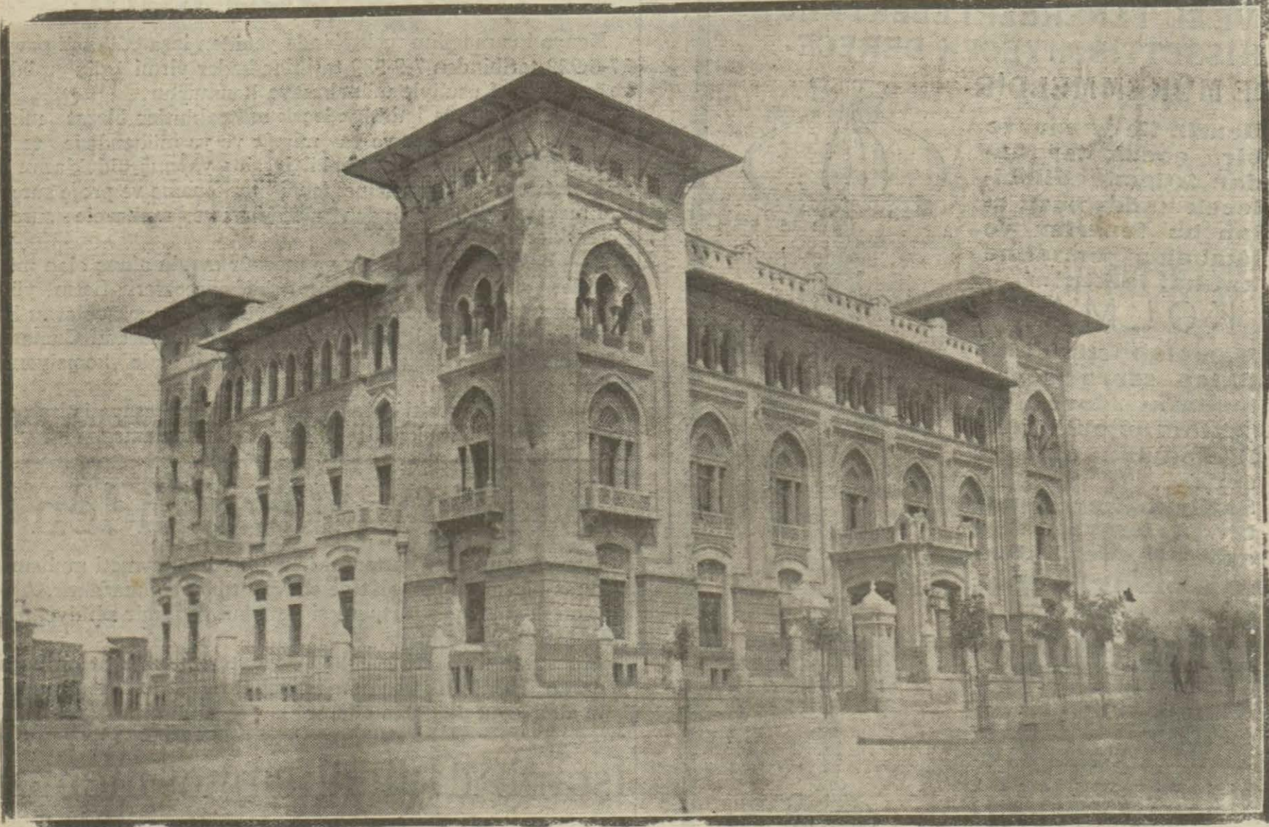
Ziraat bankasının Ankara'da yeniden inşa edilen merkez binası tefrişatı ikmal edilmiş olduğundan yakında banka muamelelerine bu yeni binada başlanacaktır.