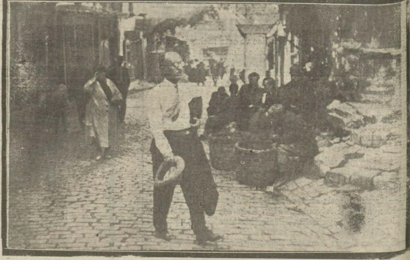
Dükkü fazla sıcaklardan bunalan bazı kimseler caddelerde caketiz olarak doğmuşlardır.