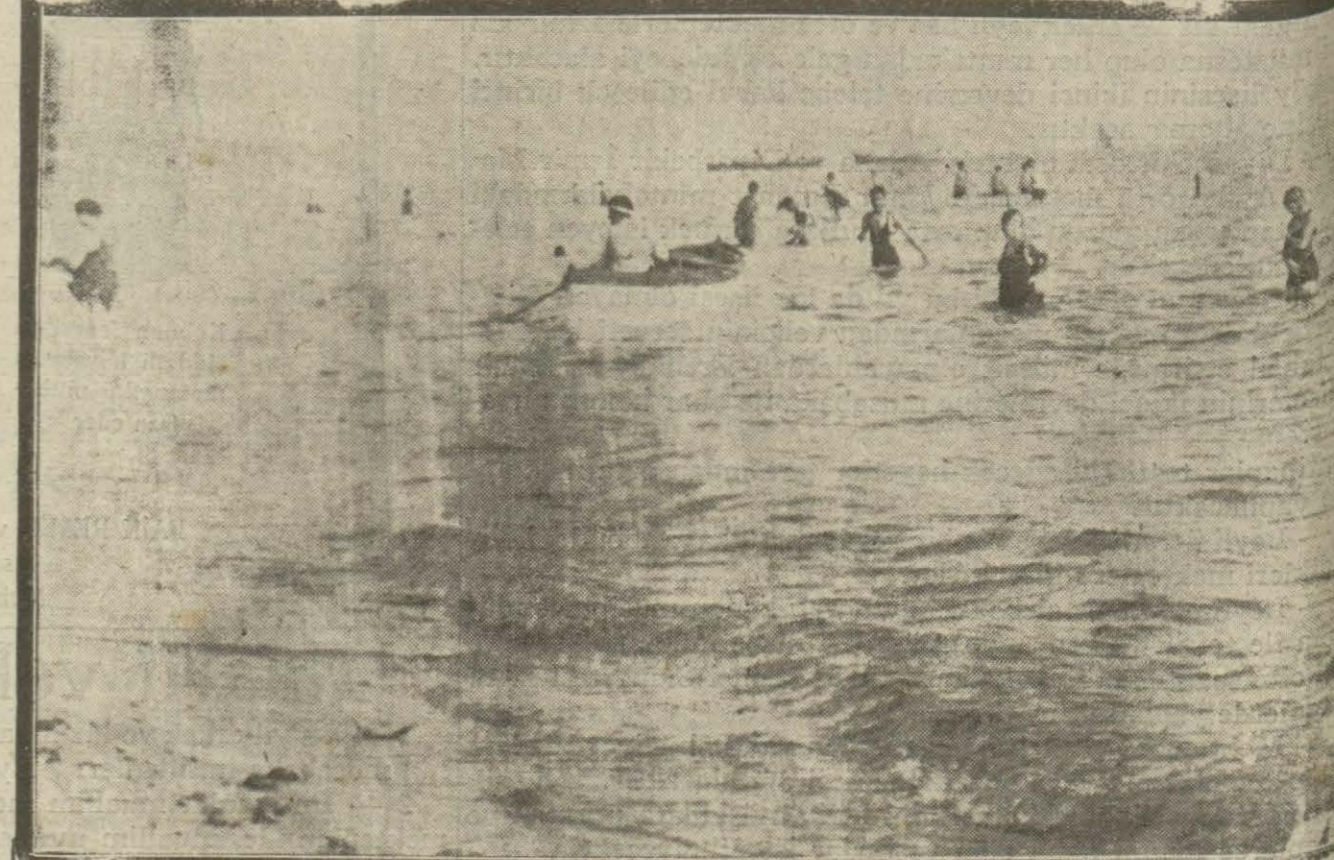
Şimdiye kadar açık sahillerde denize girmek memnudu. Şimdi bu memnuiyet r. e. n. d. Artık her kes serbestce denize girebilecektir.

Yelkenci vapurları İzmir sür'at postası Lüks İsmet paşa ve seri vapuru 25 ağustos pazar günü tam saat 15 te Galata rih-timin-izmir'e hareket edecektir. Tafsilat için Sirkeci'de Yelkenci Hanında kain acantasına müracaat. Tel. İstanbul 1515 Ve Galatada merkez rih-tim hanında Çelepidi ve Satafilopatı acantalığına müracaat. Telefon Beyoğlu 854