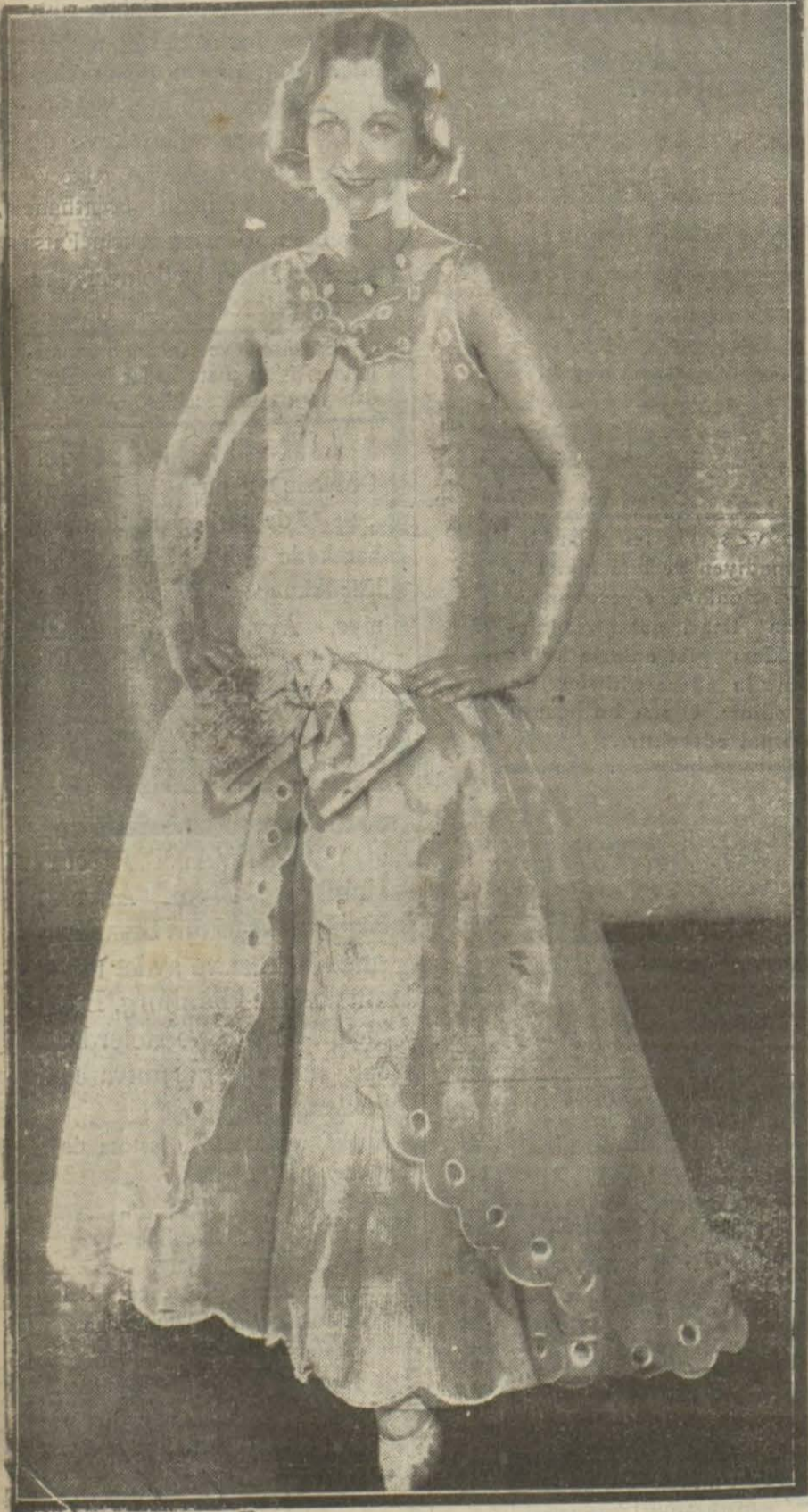
Metro - Goldwin Mayer in güzel artistlerinden Eleanor Bordmeğin giydiği şık bir rop.