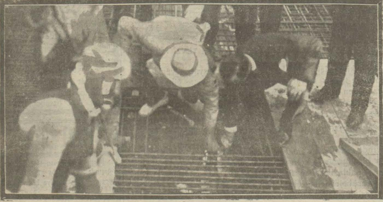
Müskirat idaresi tarafından dün Kabataştaki deponun temel atma merasimi dün yapılmıştır.