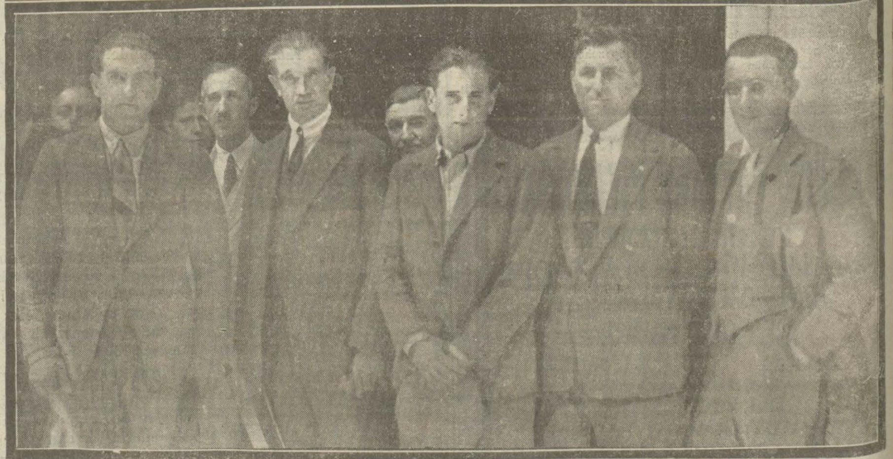
Bahrimuhit geçerek Amerikaya giden meşhur Fransız tayyarecisi Mösö Assola ve arkadaşları dün tayyare ile şehrimize mişler ve Yeşilköyde istikbal edilmişlerdir. Yazısı birinci sahifemizedir.